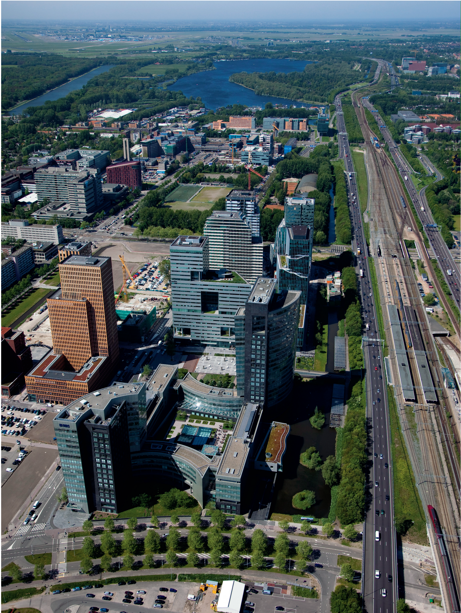
6 - Nicis Institute - Randstad 2040 is nu!