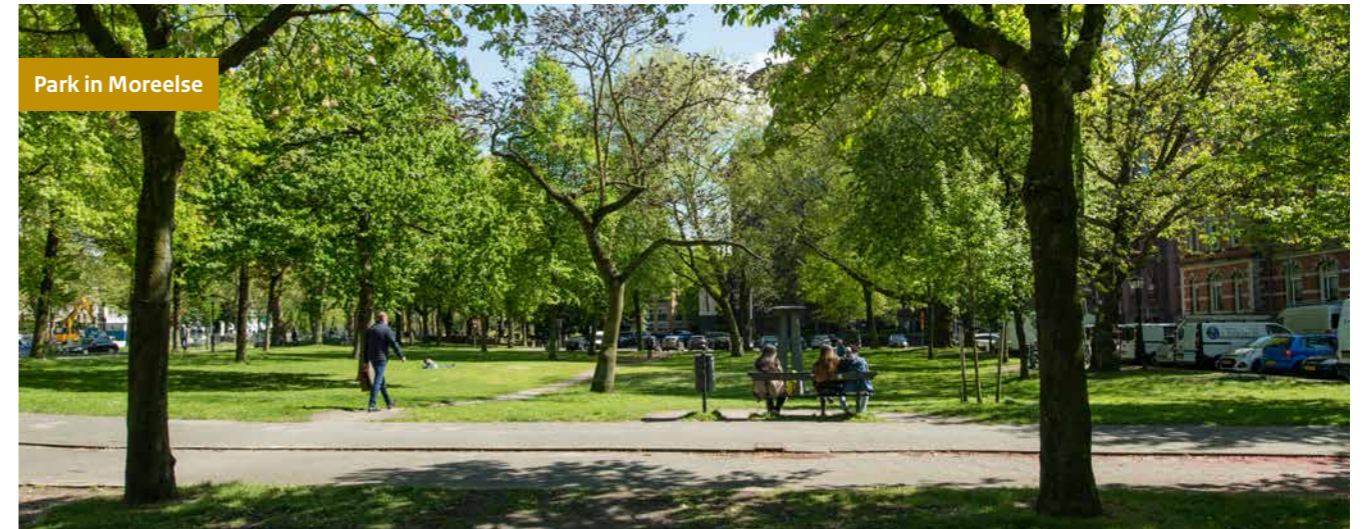
Park in Moreelse

Moreelse is een onbestemd gebied van sporen, kantoren en parkeren, maar ook van monumentale panden en bomen, een hofje en twee kleine parken. Veel (semi-) overheidspartijen als de rechtbank, Justitie, NVWA, ProRail en NS, zijn in het gebied gehuisvest. Zowel in rijksgebouwen als gehuurde onderkomens. Verzekeraar en vastgoedbelegger a.s.r. is er huisbaas van onder andere NS en ENECO heeft er een hulpstation. De school is eigendom van de gemeente.