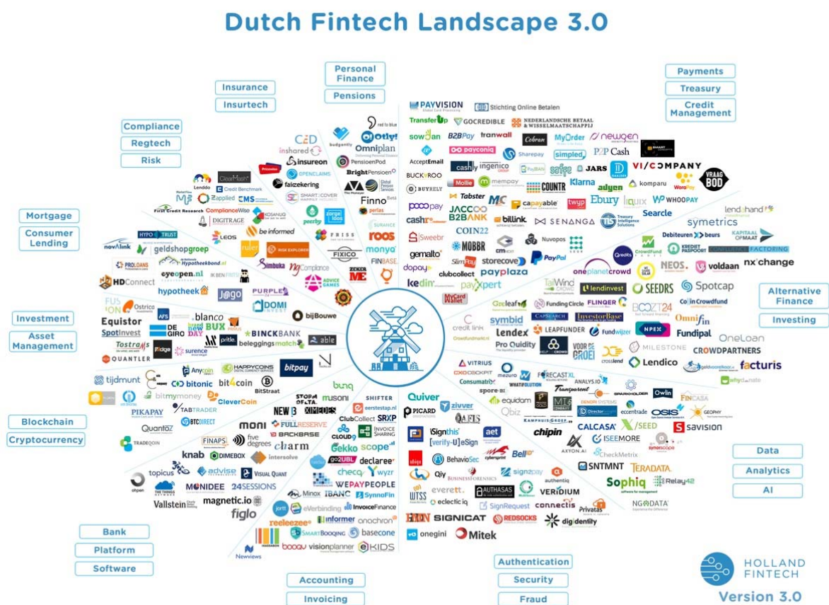
Figuur 3.2 Ecosysteem FinTech

Het ecosysteem van FinTech wordt gevisualiseerd door de infographic van Holland FinTech (Figuur 3.2).