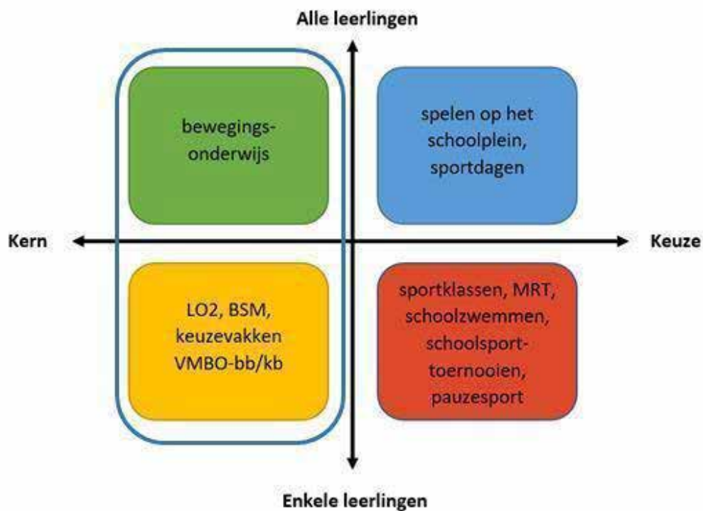
Figuur 2. Kern en keuze in het leergebied Bewegen & Sport met voorbeelden

Het curriculum beschrijft het 'wat', het 'hoe' is aan de scholen zelf. Deze visiebeschrijving gaat over het kerncurriculum, de linker twee kwadranten, waarvoor kerndoelen en eindtermen worden opgesteld die gelden voor alle leerlingen die deze vakken volgen. Het keuzedeel van het curriculum is aan de scholen zelf, zij bepalen welke inhoud worden aangeboden en welke doelen daarvoor gelden.