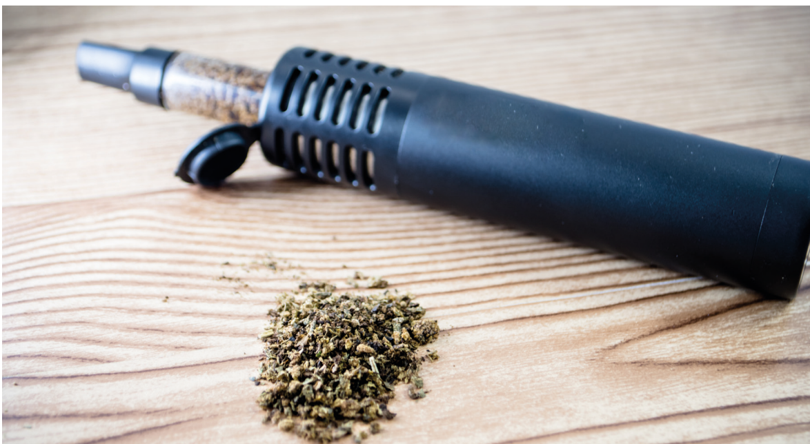
Verdampen van cannabis als plantmateriaal