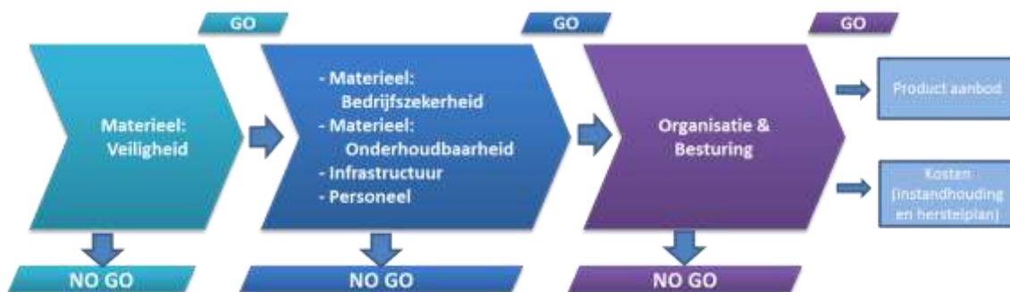
Afbeelding 3 Go/No-go-systematiek

In de plannen van aanpak van de Taskforce Fyra en van de Werkstroom V250 Techniek is een prioritering aangebracht tussen verschillende elementen. De hoogste prioriteit is gegeven aan veiligheid. Een tweede prioriteit is gegeven aan bedrijfszekerheid, onderhoudbaarheid, en Personeel. Als derde staat Organisatie en besturing opgenomen (zie onderstaand schema). Wij kunnen de keuze onderschrijven om veiligheid de hoogste prioriteit te geven.