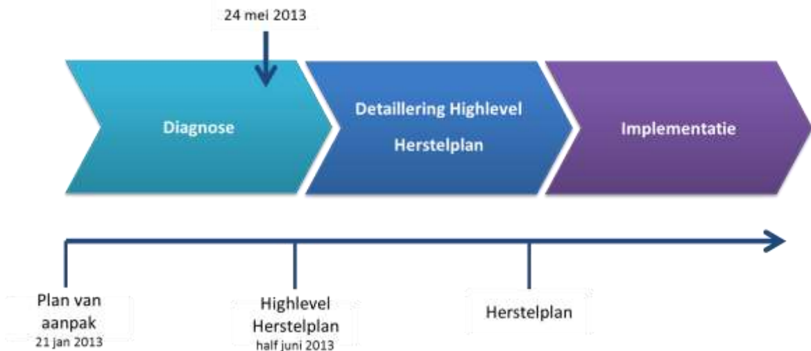
Afbeelding 1 Fasering aanpak Taskforce Fyra van de NS