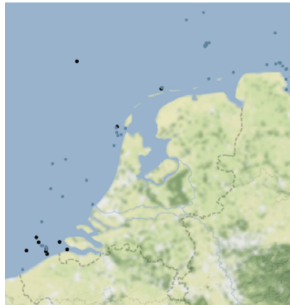
Figuur 2: Locaties in de Noordzee waar vermoedelijk munitie ligt. De blauwe stippen geven locaties aan waar conventionele munitie (bommen, granaten, torpedo's en mijnen) ligt. De zwarte stippen geven locaties weer waar de identiteit van de munitie onbekend is, maar mogelijk ligt hier ook chemische munitie (zoals mosterdgas). Hoeveel munitie er op de verschillende plekken ligt is onbekend (Ospar, 2001).

concentraties springstof in de zee en waterlichamen die in open verbinding staan met de zee.