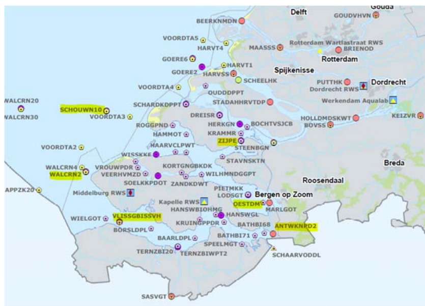
Figuur 2: Er is gekozen voor de bovenstroomse locaties Oesterdam (OESTDAM) en Zijpe (ZIJEPE). Daarnaast worden in de Westerschelde de locaties Antwerps Kanaalpannd (ANTWKND2) en Vlissingen (VLISSGBISSV) meegenomen in de analyse. Ten slotte worden springstoffen en afbraakproducten geanalyseerd in de Noordzee bij meetlocaties Walcheren 2 km uit de kust (WALCRN2), Schouwen 10 km uit de kust (SCHOUWN10) en Terschelling 10 km uit de kust (TERS LG10, niet weergegeven op bovenstaande kaart).

Om te onderzoeken of de gemeten TNT in Wissenkerke van het munitiedepot afkomstig is, dan wel er sprake is van een achtergrondconcentratie als gevolg aanvoer vanaf de Noordzee, worden in 2021 op meerdere locaties monsters genomen voor de analyse van springstoffen en afbraakproducten van springstoffen. Naast watermonster vanuit de Noordzee, worden ter controle ook watermonsters bovenstrooms het munitiedepot en uit de Westerschelde geanalyseerd op de aanwezigheid van springstoffen. De geselecteerde locaties zijn in onderstaand figuur geel gearceerd.