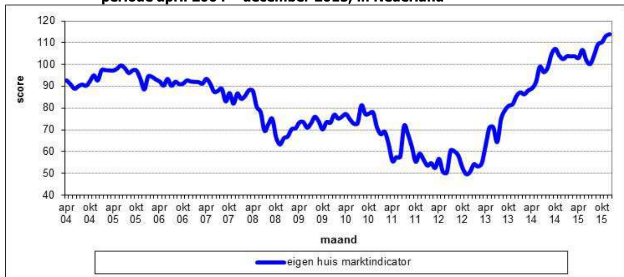
Figuur 2.1 De gemiddelde scores op de Eigen Huis Marktindicator, op maandbasis in de periode april 2004 – december 2015, in Nederland