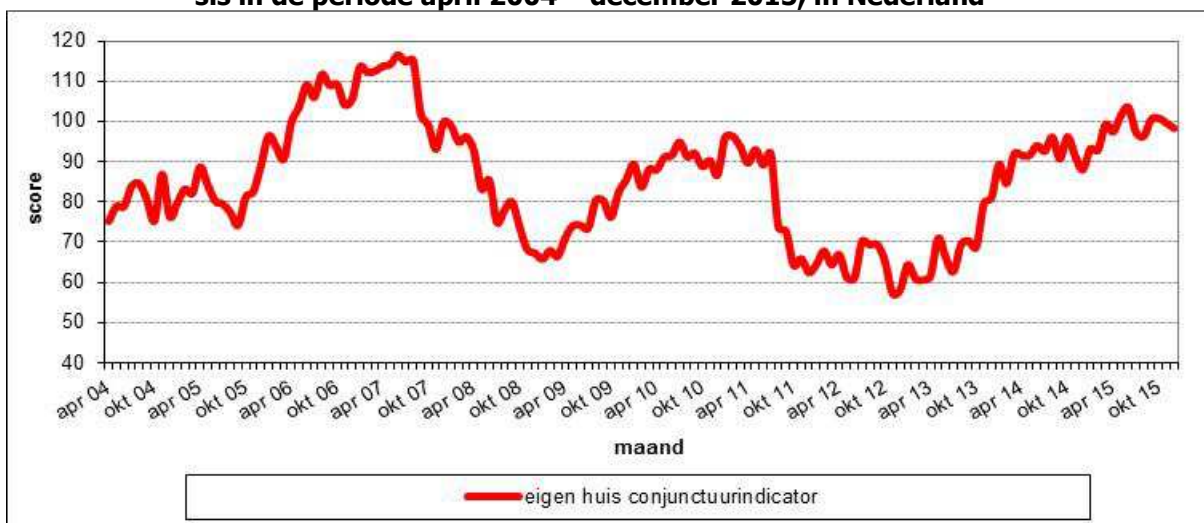
Figuur 2.3 De gemiddelde scores op de Eigen Huis Conjunctuurindicator, op maandbasis in de periode april 2004 – december 2015, in Nederland