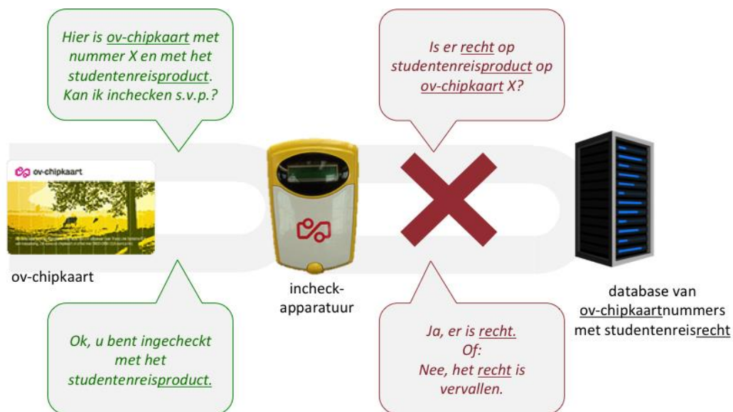
Figuur 2 – Inchecken met het studentenreisproduct. Een connectie met een database om het reisrecht te controleren is niet beschikbaar bij in- en uitchecken. Om deze reden bestaat een dergelijke database ook niet: informatie over vervallen reisrechten is niet aanwezig in het ov-chipkaartsysteem.

In het ov-chipkaartsysteem is de kaart dus leidend. Dit betekent enerzijds dat het studentenreisproduct bij in- en uitchecken ook geaccepteerd wordt wanneer het recht erop is vervallen, want die informatie is niet ter plekke. Anderzijds betekent het dat het studentenreisproduct alleen bij een ophaalautomaat 8 stopgezet kan worden.