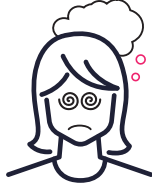
Olmayan şeyleri görme, halüsinasyon