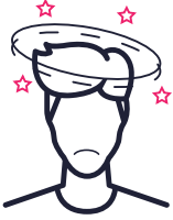
Baş dönmesi ve zihin bulanıklığı

Gülme gazı yan etkilere yol açabilir. Gülme gazının ciddi yan etkilerinden bazıları şunlardır: