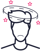
Duizelig en verward voelen

Gebruik van lachgas kan bijwerkingen hebben. Deze bijwerkingen van lachgas zijn vervelend: