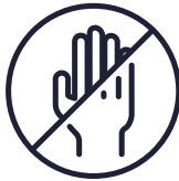
El ve ayaklarda his kaybı