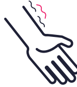
Slap gevoel in armen en benen