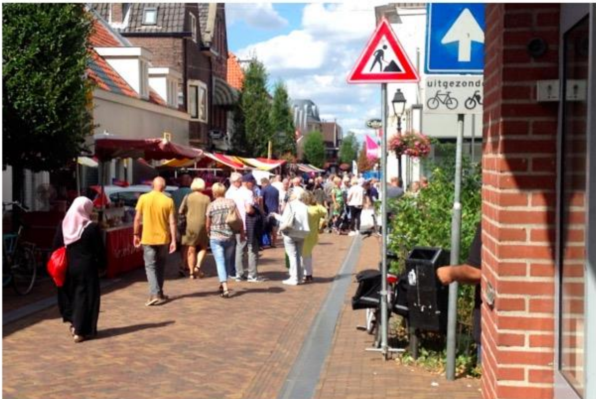
Een ander straatbeeld uit Leerdam

Het zijn dit soort grote dorpen, kleine stadjes en overloopp gemeenten die representatief zijn voor hoe Nederland in elkaar zit. Dit komt naar voren uit de cijfers , maar ook uit bezoeken aan alle gemeenten van het land. Van het midden is er het meest . Denk aan plaatsen als Heemskerk, Etten-Leur, Schagen, Elst, Weert, Vianen, Nieuwegein, IJsselstein, Gorinchem en Culemborg. Het 'Middenland' waar mensen vooral in rijtjeshuizen wonen en sommige plekken op het oog 'uit voorraad leverbaar' lijken. Kleurloos zijn deze plaatsen zeker niet, maar het is ook geen Westerpark. Politici winnen er verkiezingen, maar komen er te weinig schreef ik. Voor politici kun je hier wederom diversiteitscommissies invullen.