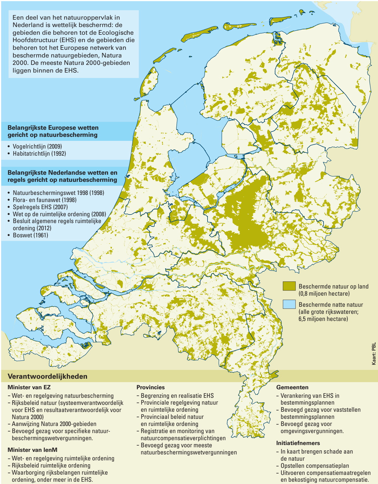
Figuur 1 Kerngegevens natuurbescherming