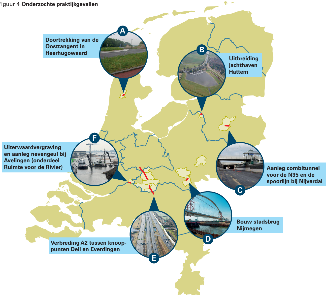
Figuur 4 Onderzochte praktijkgevallen