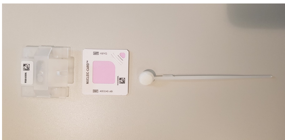
1 Afnamesponsje voor wangslim, met houder

IV Onderzoek wat de mogelijkheden zijn voor een robuuste ketenbrede ICT-ondersteuning van het werkproces, met geautomatiseerde berichtgeving in de strafrechtketen. Neem in acht wat de consequenties zijn voor de gegevensbescherming van de gevoelige en persoonsgebonden informatie die inherent aan het werkproces verwerkt moet worden. Sluit bij het onderzoek zoveel mogelijk aan bij al bestaande en operationele ICT-voorzieningen en geef een inschatting van hoeveel inspanning (kosten) en doorlooptijd de benodigde aanpassingen gaan kosten.