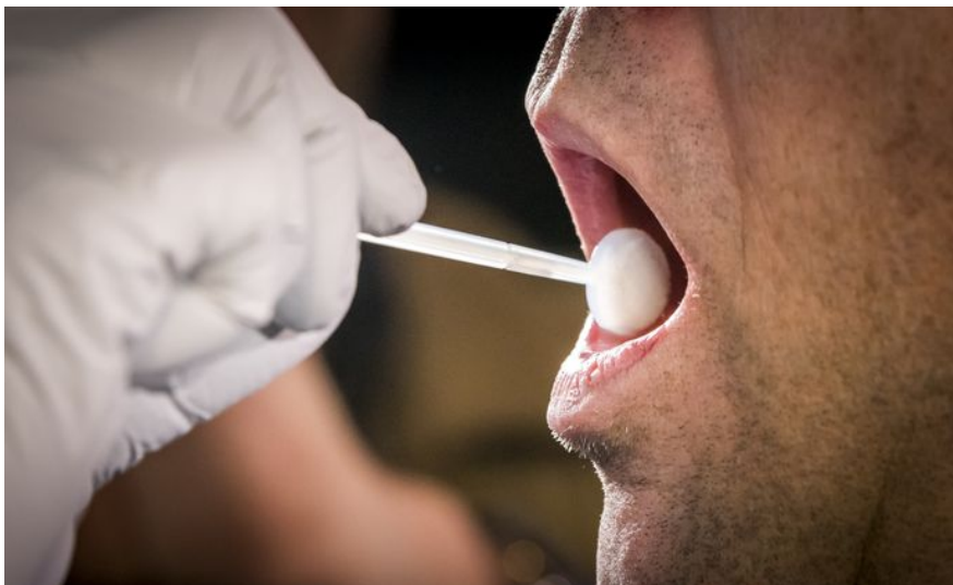
2 Afnemen van celmateriaal

De haalbaarheidsstudie kijkt naar de werkbaarheid van het werkproces. Daarbij worden de essentiële stappen van dat werkproces beschouwd, tot het detailniveau van bedrijfsproces. Dat is minder gedetailleerd dan het niveau van werkinstructie – maar voldoende voor het kunnen beantwoorden van de in hoofdstuk 2 weergegeven vragen, inclusief het maken van een grove inschatting van de hoeveelheid werk en de kosten.