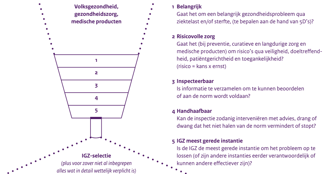
Afbeelding 3 IGZ-selectietrechter

In de IGZ-selectietrechter stoppen we de problemen, tekortkomingen en risico's die we zien. De filters 1 t/m 5 houden onderwerpen tegen of laten ze door [3] . De trechter levert ons een selectie aan te verminderen risico's op gezondheidsschade. Dat zijn er altijd meer dan we aan kunnen, dus moeten we prioriteren. We kiezen voor prioritaire aanpak van risico's die het schadelijkst zijn voor de gezondheid en die het snelst met betere naleving door ondertoezichtstaanden zijn te reduceren. We kijken welke mensen en middelen we kunnen inzetten (linkervak in IGZ-cirkel in afbeelding 2), plannen onze werkzaamheden (middelste vak in IGZ-cirkel in afbeelding 2) en leveren producten op waarmee we de naleving bevorderen (rechtvak in IGZ-cirkel in afbeelding 2). Soms moeten we via advies aan bewindslieden of aan zorgkoepels onze invloed vergroten. We gebruiken onze