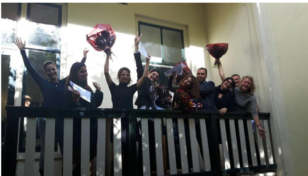
De eerste lichting Omix-deelnemers heeft hun tracé succesvol afgerond.