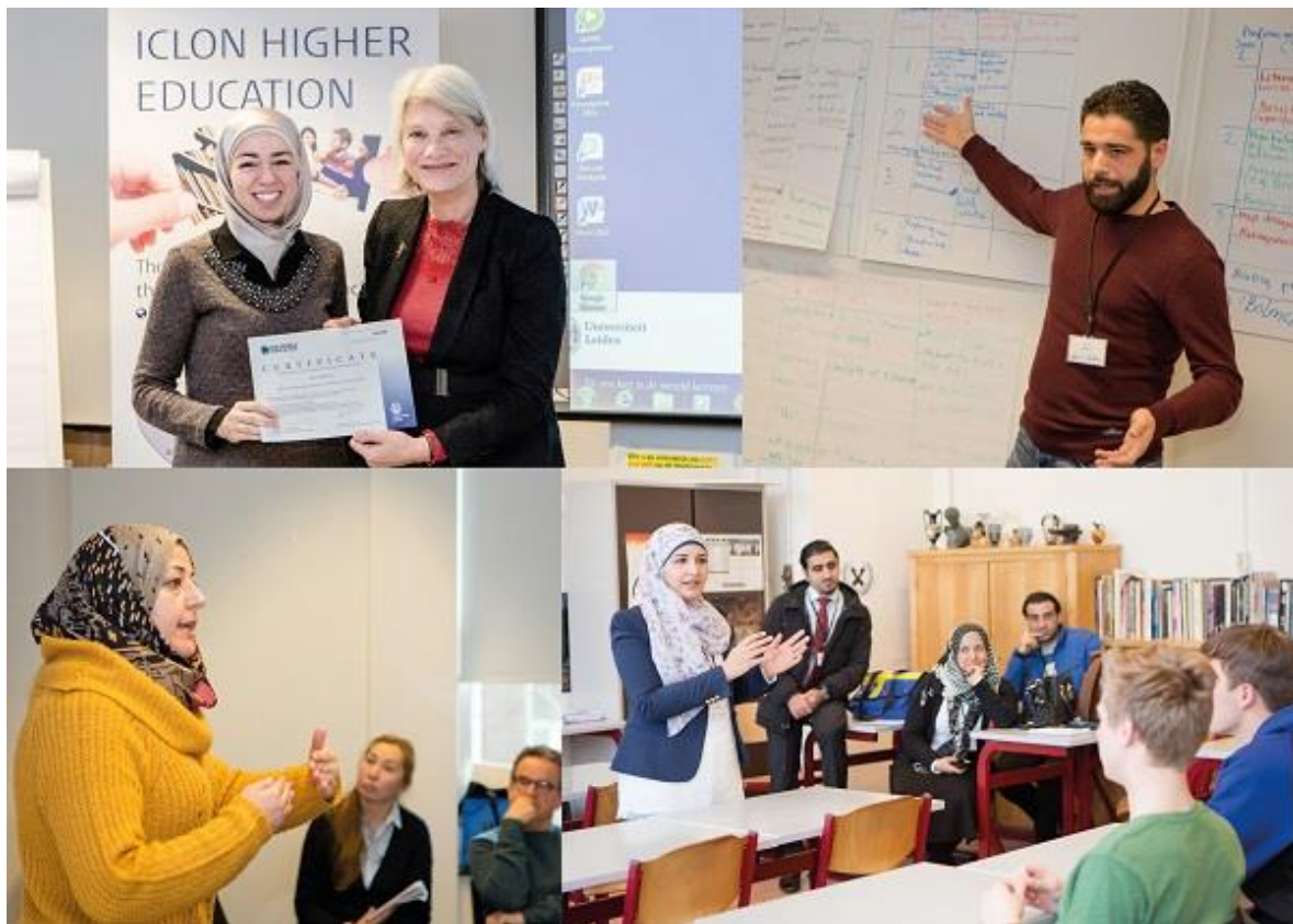
Voorlichtingsbijeenkomst voor vluchtelingen met interesse in het ICLON-traject

Vluchtelingen met een verblijfsstatus die ervaring hebben met lesgeven.