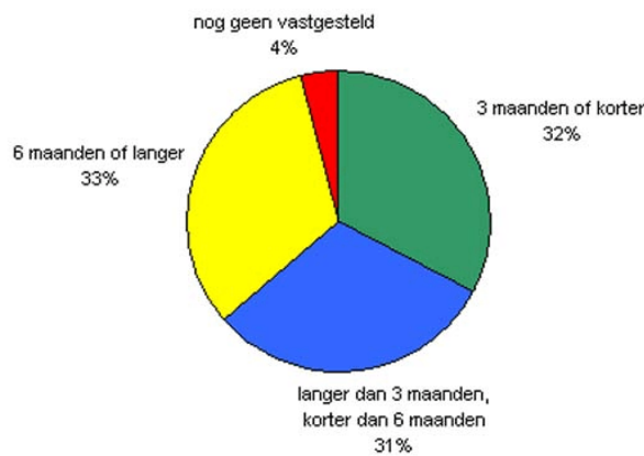
Grafiek 2 Respons op de vraag hoe lang terbeschikkinggestelden na binnenkomst in de inrichting op hun verplegings- en behandelingsplan hebben moeten wachten.

Uit de enquête komt naar voren dat eenderde 40 van de terbeschikkinggestelde zes maanden of langer heeft moeten wachten voordat het verplegings- en behandelingsplan vastgesteld is. Dertig procent 41 geeft aan langer dan drie maanden, maar korter dan zes maanden te hebben moeten wachten. Bij eenderde 42 van de verpleegden was het verplegings- en behandelingsplan wel binnen drie maanden opgesteld (zie grafiek 2).