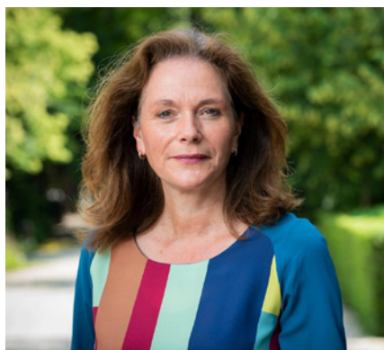
Monique Vogelzang Inspecteur-generaal van het Onderwijs (tot 1 april 2020)

Dat is waar we in 2019 mee bezig zijn geweest, waarbij we elke dag beter en effectiever willen zijn. In dit jaarverslag verantwoorden we ons over ons werk in 2019. In getallen en in een aantal belangrijke ontwikkelingen.