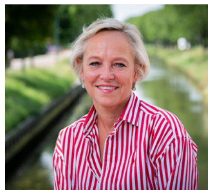
Esther Deursen waarnemend Inspecteur-generaal van het Onderwijs (vanaf 1 april 2020)