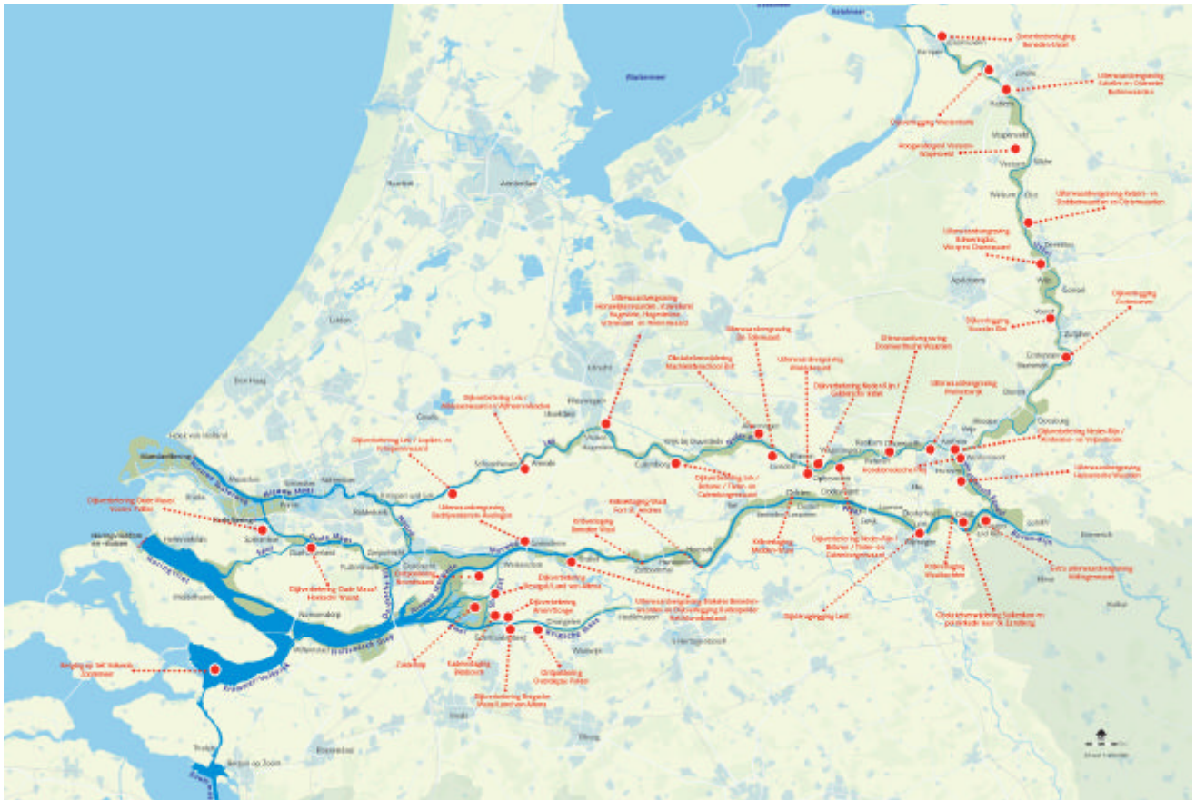
Afbeelding 3.1 Maatregelen Ruimte voor de Rivier

In VGR9 is uitgebreid ingegaan op de scope van het programma Ruimte voor de Rivier. In de daarop volgende voortgangsrapportages worden alleen mutaties in de scope apart in dit hoofdstuk vermeld. Een scopemutatie is aan de orde wanneer de scope in de projectbeslissing (SNIP 3) afwijkt van die in de PKB. De scope beperkt zich tot type maatregel, locatie van de maatregel, ruimtelijke bestemming van het maatregelgebied en de taakstelling voor de MHW-verlaging.