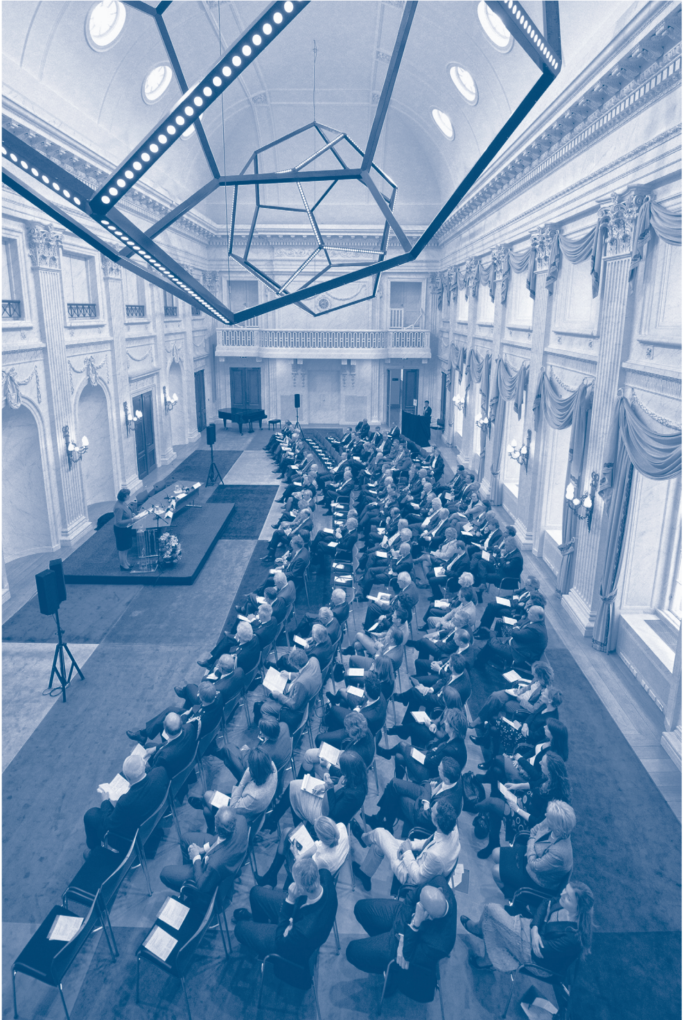
Symposium van 18 april 2012.