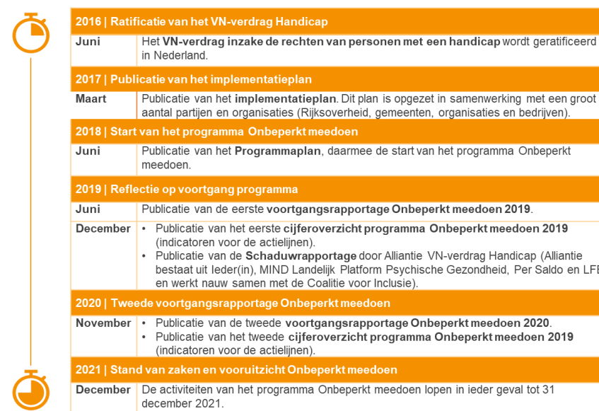
Figuur 1. Tijdlijn van documentatie over programma Onbeperkt meedoen!

Figuur 1 bevat een tijdlijn met verwijzingen naar relevante documentatie over het programma Onbeperkt meedoen! vanaf de ratificatie van het VN-verdrag in 2016, de start van het programma in 2018 tot en met de huidige situatie in 2021.