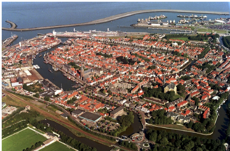
2. Zeshonderd monumentale panden op één vierkante kilometer