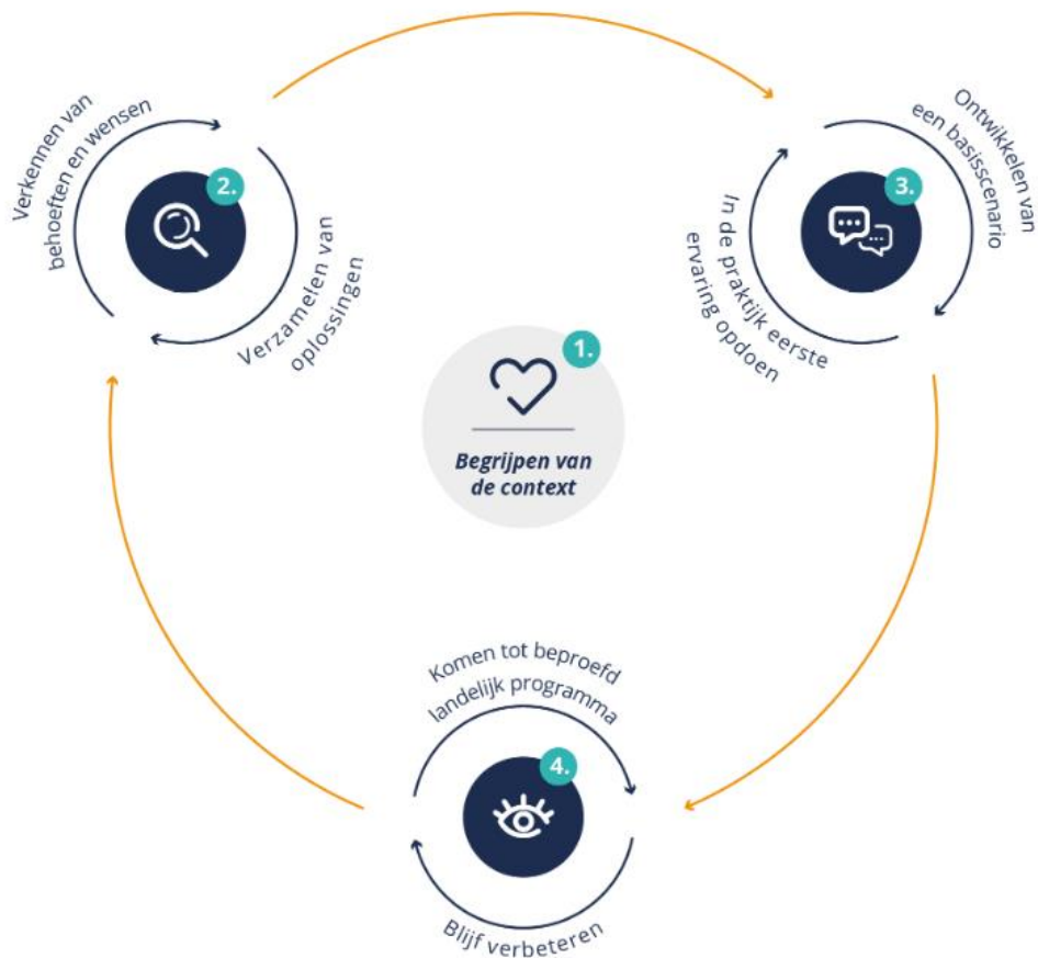
Figuur 3. Overzicht van verschillende processtappen in de ontwerpbenadering

1. Begrijpen van de context. Bij het ontwikkelen van een (nieuw) concept is het belangrijk dat er kennis is van de context. In dit geval: kennis van het werkveld van wijkverpleging, kennis van de dynamiek van het werk.