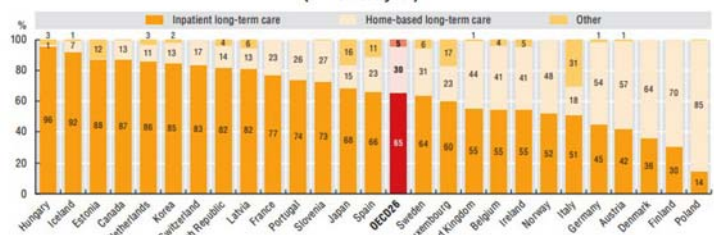
11.25. Government and compulsory insurance spending on LTC (health) by mode of provision, 2015 (or nearest year)

Note: "Other" includes LTC day cases and outpatient LTC.