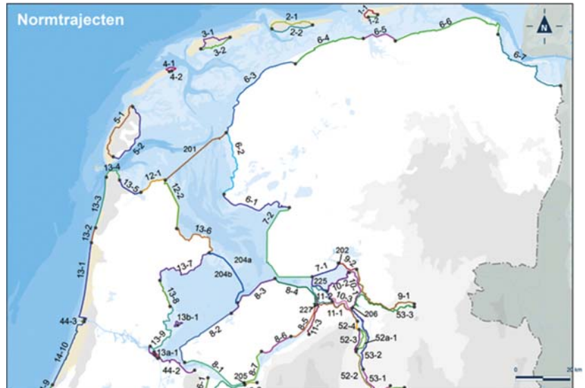
Kaart 1: Noord-Nederland

1. Kaart 1: Noord Nederland wordt vervangen door: