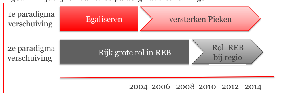
Figuur 1 Tijdslijnen van twee paradigmaverschuivingen

te ronden PiD-projecten) is zich dat pas vanaf 2012 duidelijker gaan manifesteren. 3