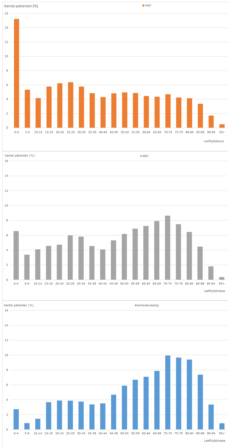
Figuur 1: Aantal patiënten dat gebruik maakt van de HAP (boven, 2019), de SEH (midden, 2018) en spoedeisende ambulancezorg (onder, 2019), als percentage van het totaal in een jaar, naar leeftijdsklasse.