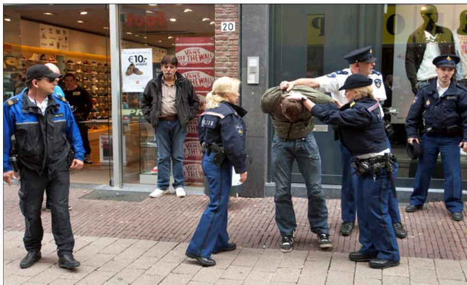
De regiopolitie Gelderland-Midden oefent in de Arnhemse binnenstad (7 april 2011).