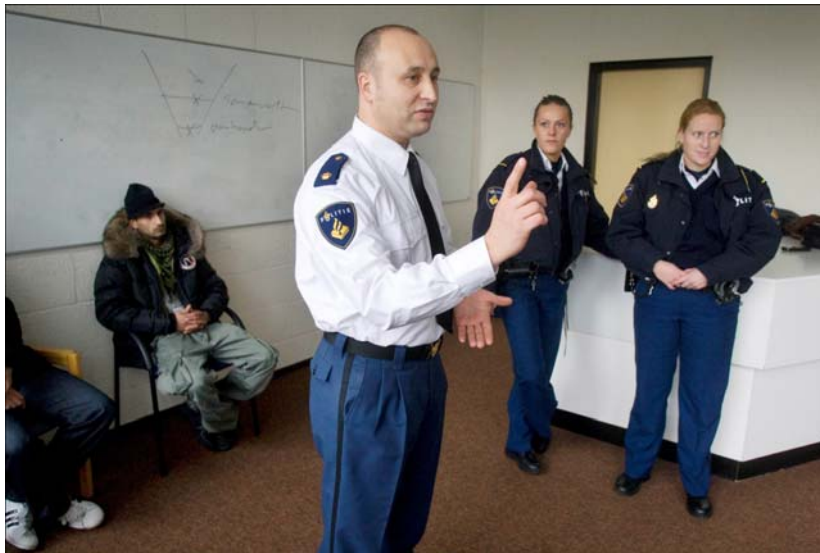
Leerlingen van de politieschool krijgen praktijkles over de omgang met Marokkaanse jeugd (5 december 2008).