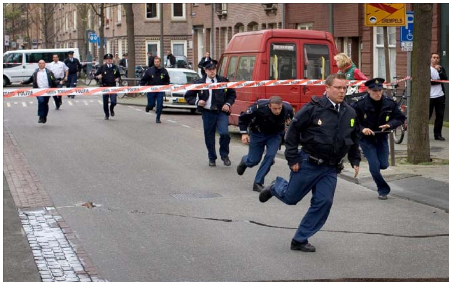
In de Amsterdamse Westerpark-buurt komen ongeveer tien dienders aangerend om collega-agenten te assisteren die bij de arrestatie van twee Marokkaanse jongemannen op collectief verzet stuiten (11 april 2007).