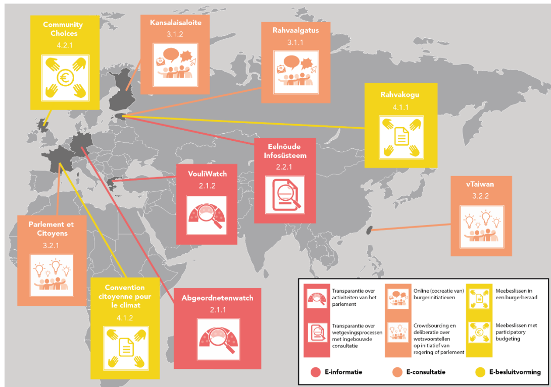
Figuur 1 Overzicht van de onderzochte digitale democratie-instrumenten

stil bij verschillende algemene voorwaarden die van belang zijn bij het succesvol invoeren van verschillende vormen van digitale burgerbetrokkenheid in Nederland.