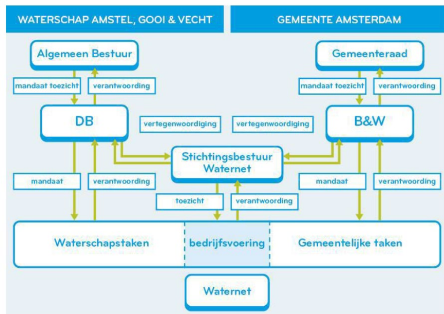
Figuur: Structuur stichting en mandatering-verantwoording

In onderstaande figuur is de mandatering en verantwoording tussen het Stichtingsbestuur Waternet, het Waterschap AGV en de gemeente Amsterdam schematisch weergegeven.