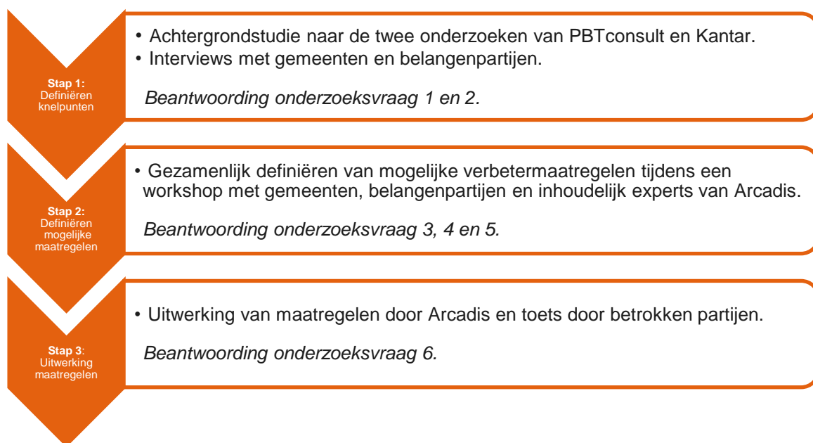
Figuur 1: Onderzoeksaanpak

Om bovenstaande onderzoeksvragen te beantwoorden, is een aanpak in drie stappen gehanteerd. In onderstaande figuur (Figuur 1) zijn de stappen en bijbehorende onderzoeksmethode weergegeven.