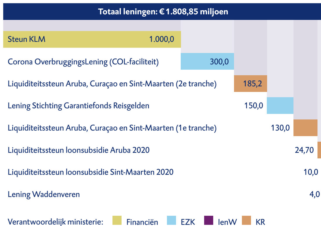
Figuur 3 Overzicht leningen coronacrisis