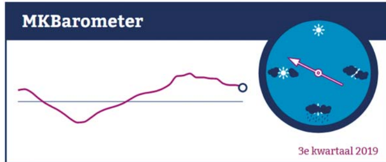
Figuur 1: MKBarometer in het 3e kwartaal van 2019

Sinds 1 oktober staat ook de tool «MKBarometer» online op www.staatvanhetmkb.nl . Dit is een afgeleide van de mkb conjunctuurklok en geeft in één blik weer wat de stand van de conjunctuur van het mkb is (zie figuur 1).