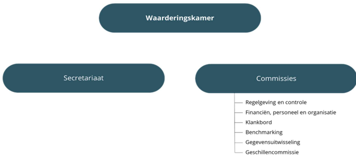
Figuur: schematische weergave waarderingskamer

De Waarderingskamer bestaat uit een bestuur (de leden van het zbo), het ondersteunende secretariaat en meerdere commissies. In de Wet WOZ (Hoofdstuk II) staat de samenstelling van de Waarderingskamer beschreven. Ter nadere uitwerking is op grond van artikel 10 Wet WOZ een bestuursreglement vastgesteld. 19