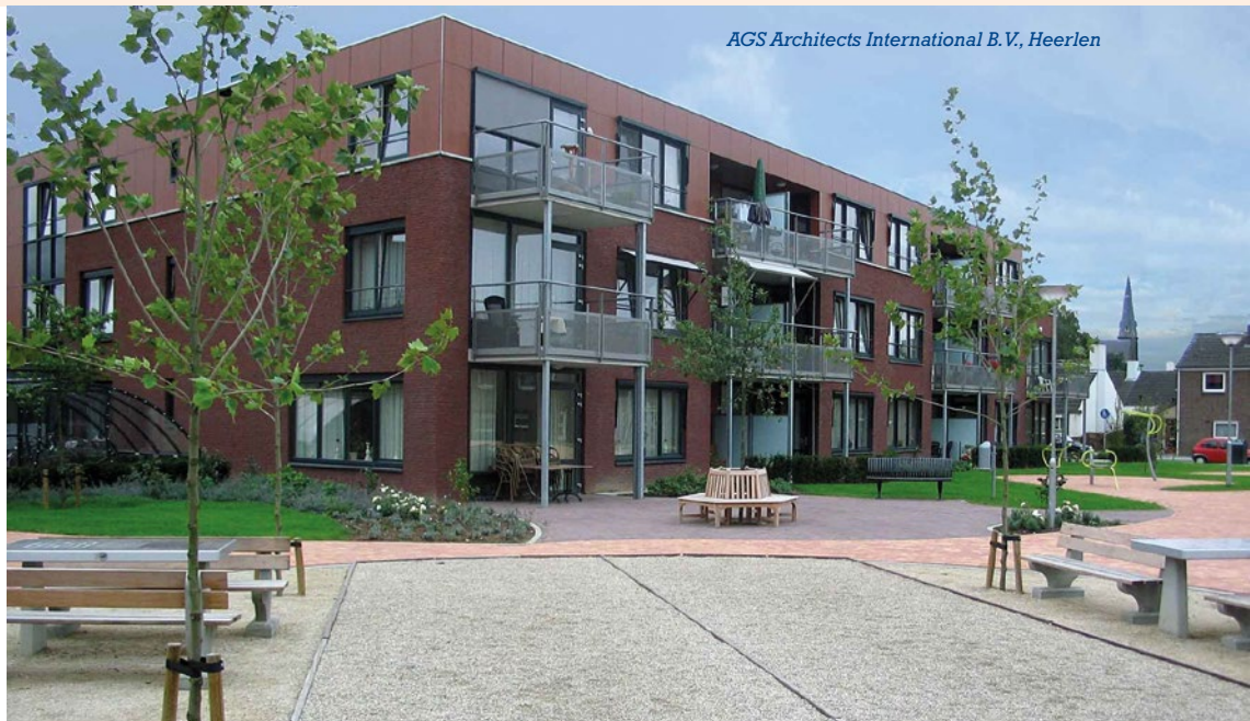
AGS Architects International B.V., Heerlen