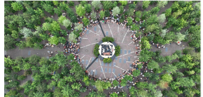
Figuur 4 Bosk 15