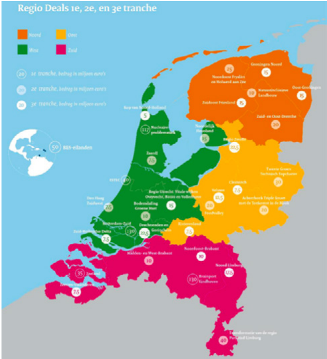
Figuur 2. Drie tranches Regio Deals

Regio's fungeerden als knooppunt voor de deals, niet alleen voor het identificeren en realiseren van uiteenlopende maatschappelijke opgaven en het creëren van brede welvaart, maar ook voor interacties tussen verschillende partijen en niveaus. Een regio in het kader van de Regio Deals was geen vaststaande geografische of administratieve eenheid, maar een gebied dat voor een specifieke economische, sociale en/of ecologische uitdaging stond. De regio werd als het ware geformeerd rond de maatschappelijke opgave en kon dus zo groot zijn als een aantal provincies bij elkaar (bijvoorbeeld Noord-Nederland) of zo klein als een aantal wijken in een enkele gemeente (zoals in Den Haag Zuidwest).