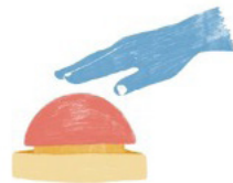
Figuur 2 Rode knop (uit Potjer, 2019)

Een tweede voorbeeld van de inventieve octopus is het reeds afgeronde 'Ruimte voor de Rivier'-programma (dat liep van 2006-2019). In dit programma verbeterden Rijk en regio's (oftewel provincies, gemeenten, waterschappen en maatschappelijke partners) samen de waterveiligheid en ruimtelijke kwaliteit van riviergebieden in Nederland. Het programma wordt breed gezien als een zeer geslaagde publieke samenwerking. Wat een belangrijke rol speelde, was het ingenieuze 'omwisselbesluit': een juridisch instrument waarmee het Rijk een uitnodiging deed naar de regio's om met lokale en creatieve voorstellen te komen voor de voor hun betreffende riviergebieden. Het Rijk formuleerde de plannen en doelen op hoofdlijnen, maar scheidde door middel van het omwisselbesluit de formele mogelijkheid om stukjes van dat plan 'om te wisselen' met betere lokale invullingen. Dit ontwerp zette iedere bestuurslaag in haar kracht – het Rijk coördinerend en richtinggevend, de regio's met de creatieve zoekruimte om voorstellen te ontwikkelen die lokaal