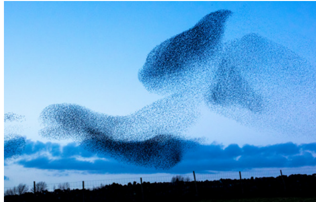
Figuur 3 Zwerm

Het is een vraag die meer mensen bezighoudt. Biologen onderzoeken al lange tijd het complexe fenomeen van zwermgedrag . Eén van de verklaringen van hoe het kan dat zulke grote groepen vogels naadloos samen vliegen zonder dat er een formatie of leider is, is dat de vogels elkaar voortdurend in de gaten houden en hun gedrag aanpassen op elkaar. Om precies te zijn: één individuele vogel houdt tot zeven buurvogels in de gaten. Als er dan één vogel van koers verandert, bewegen de omringende vogels onmiddellijk mee en zo verspreiden bewegingen zich razendsnel door de wolk. In een zwerm kunnen tot wel 750.000 vogels (!) zitten. Zonder vormen van hiërarchische sturing bereiken ze belangrijke gezamenlijke doelen, zoals de verplaatsing van plek naar plek en de bescherming van de groep tegen aanvallers. Zwermgedrag wordt daarom ook wel ‘collectieve intelligentie’ genoemd.