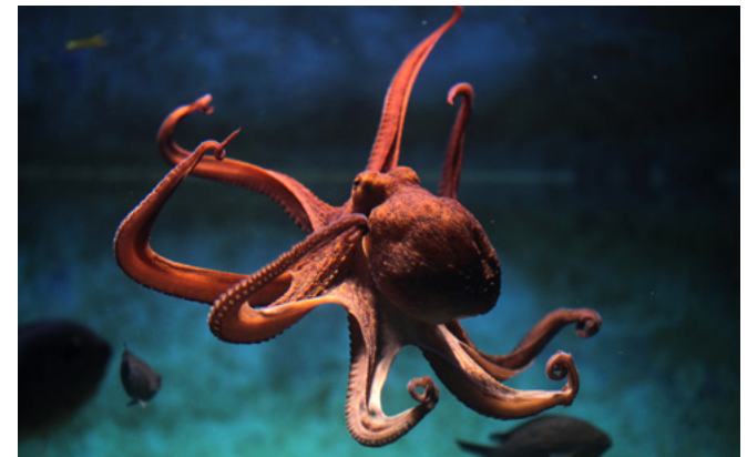
Figuur 1 Octopus

In het Brighton Aquarium in 1875 stonden medewerkers voor een raadsel. Op onverklaarbare wijze verdwenen uit één van de aquaria steeds opnieuw een paar steenkruipers, een Aziatische vissoort. Wat het veroorzaakte was lange tijd onduidelijk. Totdat de medewerkers achterhaalden dat er één bewoner was die zich in de nacht uit het eigen aquarium wist te wurmen, zijn weg vond naar dat van de steenkruipers, er een paar opat en dan weer terugkeerde naar de eigen bak om daar in de ochtend te worden aangetroffen. Wie het was? Juist, de octopus.