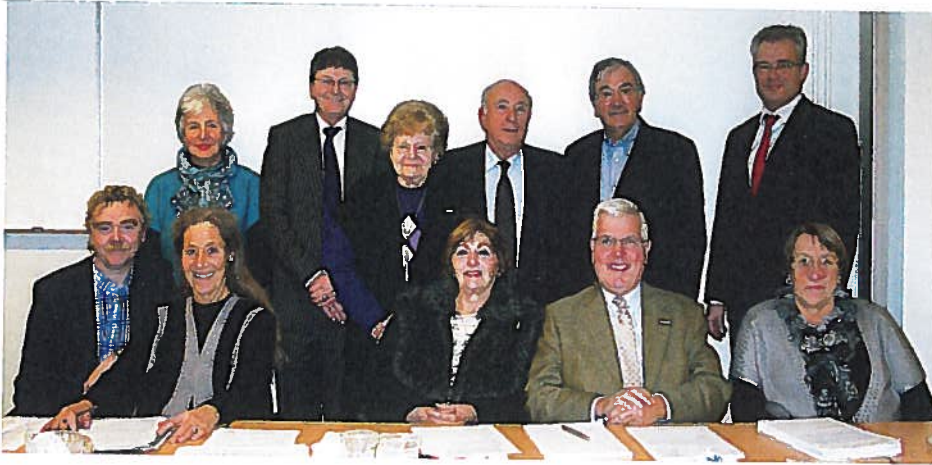
Cliëntenraad Verzetsdeelnemers en Oorlogsgetroffenen.

Voor het optimaal functioneren van de Raad is een goede samenwerking noodzakelijk. De Raad bespreekt ontwikkelingen en signalen daarom geregeld met de leidinggevenden van de afdeling Verzetsdeelnemers en Oorlogsgetroffenen, met de Raad van Bestuur van de SVB en met de leden van de Cliëntenraad.