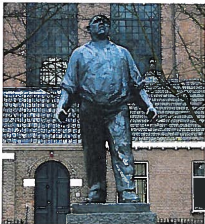
Monument "De Dokwerker" voor de Februaristaking 1941 van beeldhouwer Mari Andriessen.

Vanuit de verantwoording voor het beleid is het voor de Raad van groot belang om voeling te houden met wat er leeft onder de verschillende doelgroepen van de wetten voor verzetsdeelnemers en oorlogsgetroffenen binnen Nederland en in het buitenland.