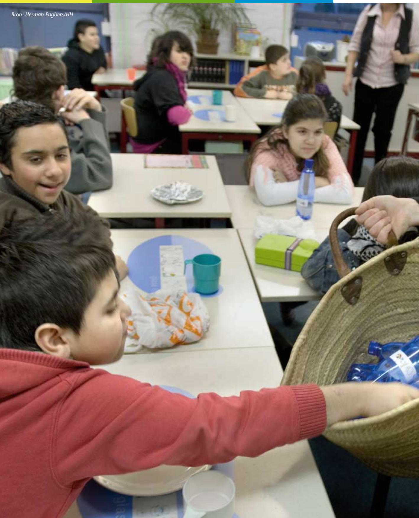
Ontbijtles op basisschool