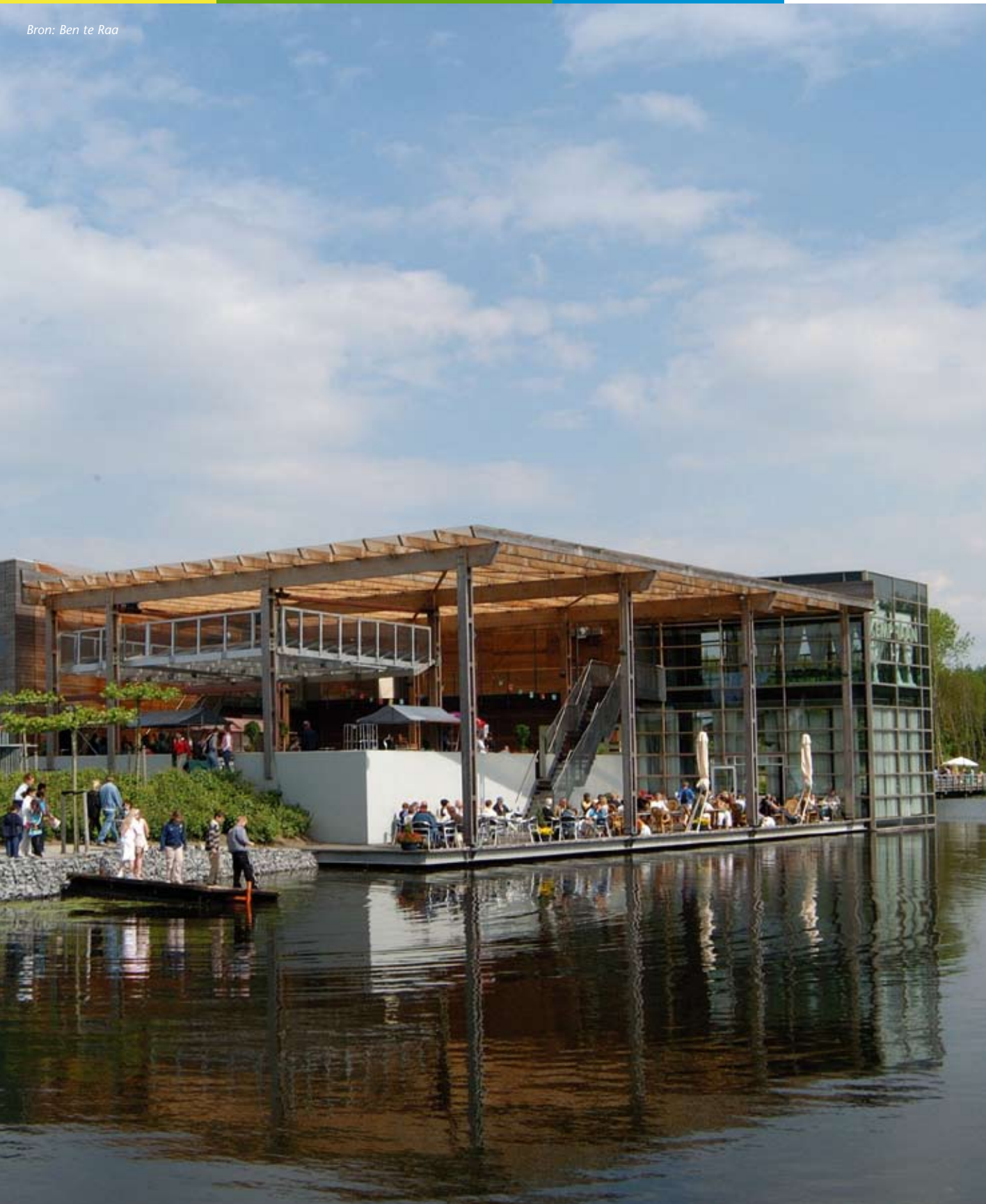
Stadslandgoed De Kemphaan in Almere

Duurzaamheid wordt nogal eens gebruikt als argument om voor regionaal of lokaal voedsel te kiezen. Tegelijkertijd lijkt 'regionaal' of 'lokaal' een waarde op zichzelf te worden. Daarbij wordt waarde gehecht aan duurzaamheid maar ook aan het weten waar het voedsel vandaan komt en zich daarmee kunnen identificeren, zich verantwoordelijk voelen of thuis voelen. 50