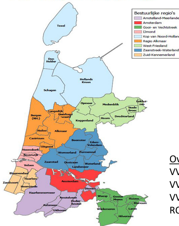
Gemeenten per bestuurlijke regio