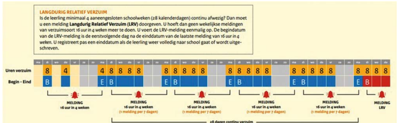
Figuur 3: Langdurig relatief verzuim.