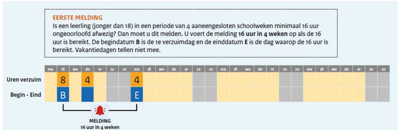
Figuur 2: Eerste melding 16 uur in 4 weken