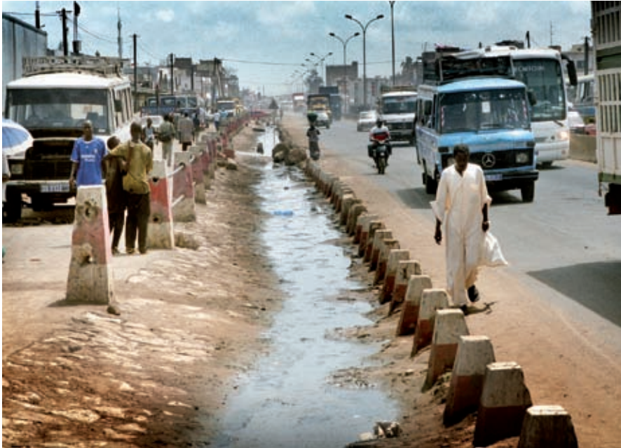
Dakar, Senegal: open riool.

De totale hulp voor de watersector in de periode 1998-2006 bedraagt EUR 313 miljoen. Figuur 1.2 laat zien dat de uitgaven voor water terugliepen in de periode 2000-2004, maar daarna weer opliepen om in 2006 het niveau van 1998-1999 te bereiken. Een reden voor deze daling is de vermindering van middelen voor de bilaterale hulp. Ter gelegenheid van het Wereld Water Forum van 2000, dat in Nederland werd gehouden, beloofde Nederland een extra financiële bijdrage voor waterbeheer van EUR 45 miljoen per jaar. Daarnaast was de hierboven genoemde afspraak om extra bij te dragen aan de MDG doelstellingen op het gebied van drinkwater en sanitaire voorzieningen een reden voor toename van de middelen voor water. Daardoor zijn de totale uitgaven aan de watersector in de periode 2004-2006 in vergelijking met de voorgaande periode weer wat toegenomen en bedroegen EUR 411 miljoen. 16