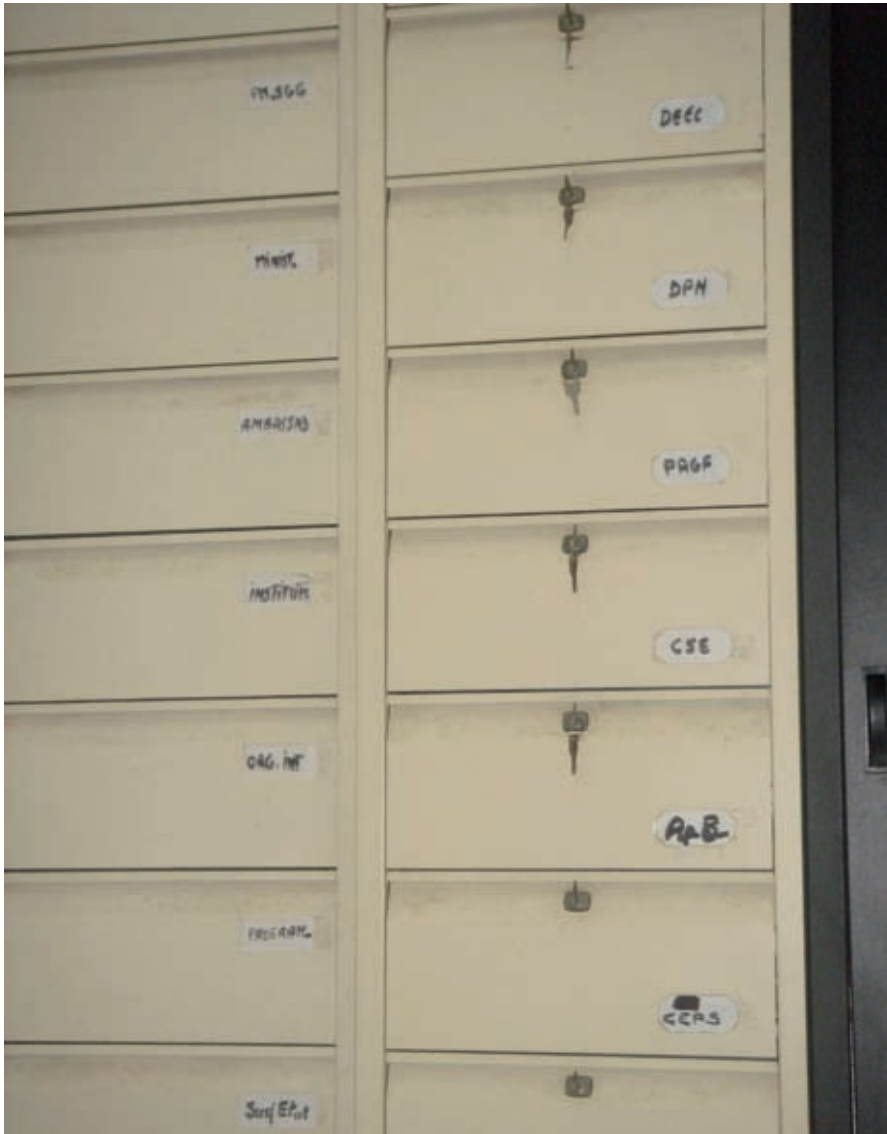
Senegal: in de archieven van het ministerie is het dossier begrotingssteun (ApB) opgeslagen tussen de projectdossiers.

programma afgebouwd. In de nieuwe overeenkomst tussen Nederland en Senegal werd een maximum bedrag van EUR 67,5 miljoen afgesproken voor de periode 2005-2009. In principe bestaat deze bijdrage uit een vaste allocatie van EUR 7,5 miljoen jaarlijks en een variabele allocatie, die afhankelijk is van de score op vastgestelde indicatoren in het resultatenraamwerk voor milieu. Als onderdeel van de overeenkomst is een strategische planning afdeling opgezet in het ministerie van