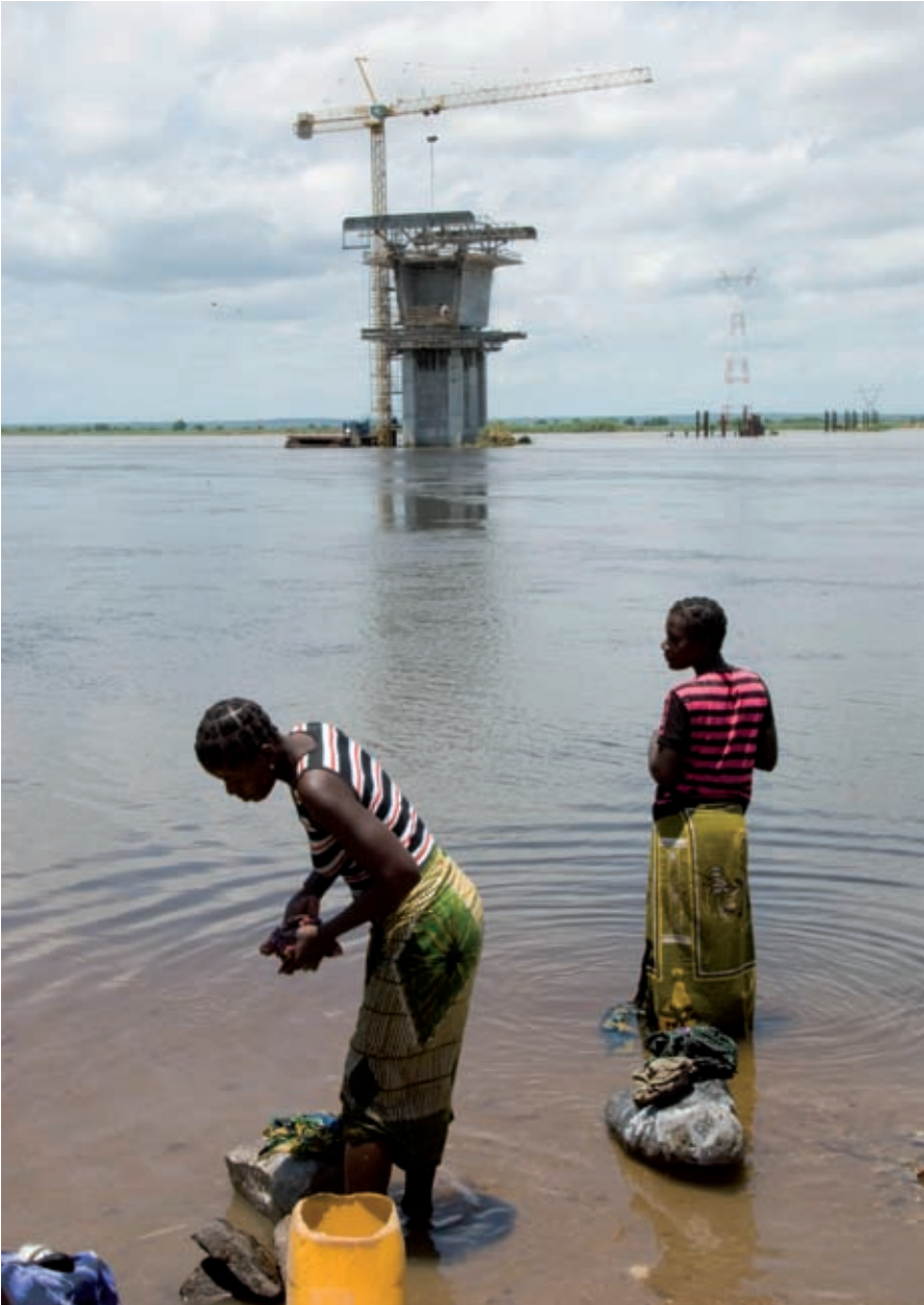
Mozambique: vrouwen doen de was met op de achtergrond de eerste peiler van de in aanbouw zijnde Zambezibrug. De brug wordt gefinancierd door o.a. de EU en Zweden.