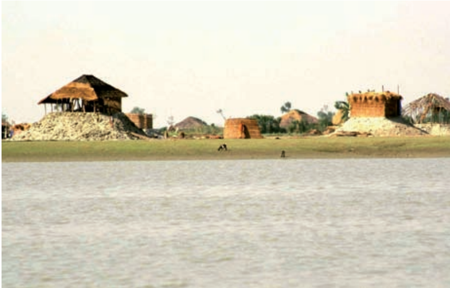
Bangladesh: projectsteun voor armoedebestrijding: Nederlandse steun voor de bewoners van de buitendijkse gronden (Charlands).

om dit te bewerkstelligen zijn gewoonlijk zwak ontwikkeld: gespecialiseerde onderhoudsbedrijfjes of reserve onderdelen zijn in afgelegen plattelandsgebieden vaak niet voor handen. Dit maakt de duurzaamheid van deze voorzieningen onzeker.