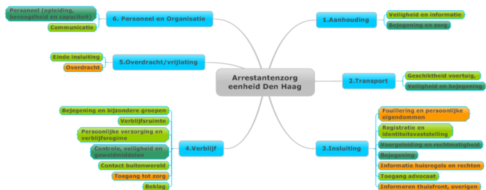
Figuur 5: Eindoordeel proces arrestantenzorg en deelaspecten

In de voorgaande hoofdstukken zijn verschillende aspecten van de arrestantenzorg aan de orde gekomen. Over een aantal onderwerpen hierbinnen zijn de inspecties erg positief en een aantal onderwerpen verdienen nog aandacht. Onderstaande figuur geeft een totaaloverzicht van de wijze waarop het proces arrestantenzorg functioneert op alle getoetste aspecten en daarbij behorende onderwerpen. In deze figuur is met kleurcodes aangegeven in welke mate de arrestantenzorg voldoet aan de gestelde normen en verwachtingen op de verschillende onderwerpen binnen de toetsingskaders van IVenJ en IGZ: donkergroen wil zeggen dat de arrestantenzorg volledig voldoet, lichtgroen wil zeggen voldoet overwegend maar niet volledig, oranje houdt in dat de arrestantenzorg in beperkte mate voldoet aan de criteria en een rode kleur wil zeggen dat de arrestantenzorg niet voldoet.