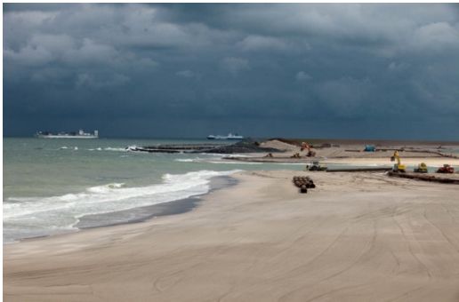
Foto: Na startsein van HM Beatrix sluiting Sluitgat (11 juli 2012)