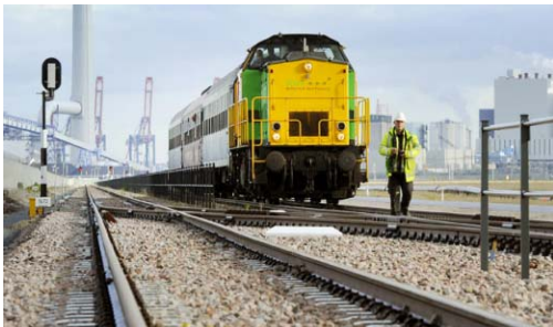
Foto: Ingebruikname Spoor (oktober 2012)