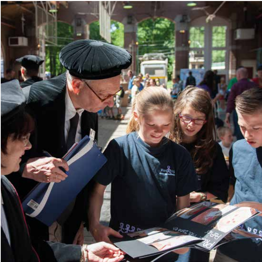
Elk jaar vindt het populaire Techniek Toernooi plaats, een techniekwedstrijd voor leerlingen uit alle groepen van het basisonderwijs. Het wordt gesponsord door bedrijven, kennisinstellingen en organisaties die techniek een warm hart toedragen en het belang van wetenschap en techniek voor de toekomst inzien. Professoren, in toga en met baret, vormen de hooggeleerde jury.