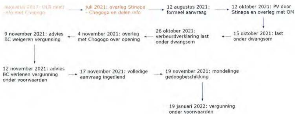
Figuur 3: de belangrijkste momenten op een rij

De vergunning, met daarin onder andere opgenomen dat voor 31 maart 2022 Chogogo moet voldoen aan een aantal voorwaarden (onder andere ten aanzien van de keermuur), is op 19 januari 2022 verstrekt. Ten tijde van het verstrekken van de vergunning is de uitslag van het onderzoek dat het OLB laat uitvoeren naar de kwaliteit van het gebruikte zand nog niet bekend.