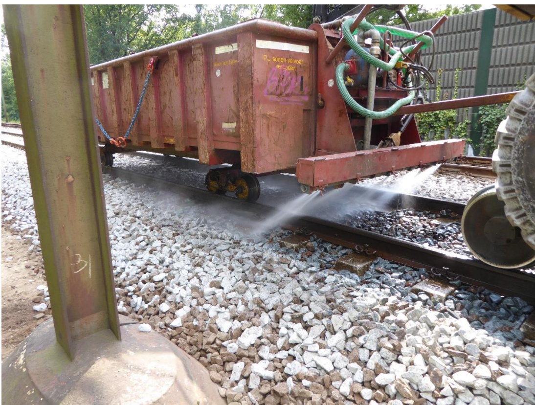
Afbeelding 2: nat maken geloste ballast met lorriecontainer