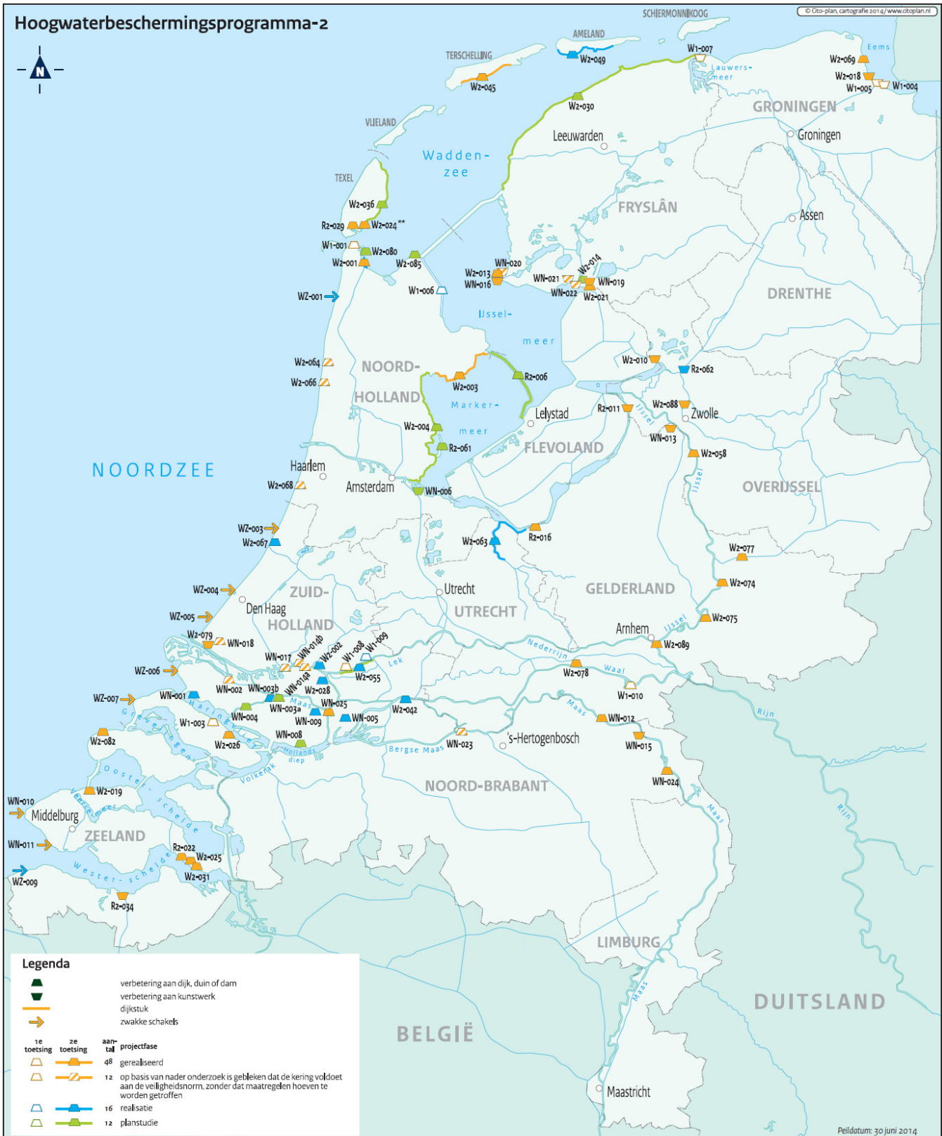
Figuur 2 Actuele scope van het programma, peildatum 30 juni 2014