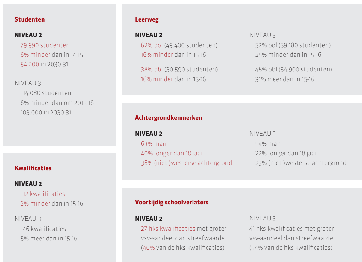
Figuur 3: studenten in cijfers 9

De groep studenten die het moeilijk heeft binnen het huidige stelsel kenmerkt zich door een meer dan gemiddeld grote behoefte aan begeleiding en/of onvoldoende zicht op eigen mogelijkheden en drijfveren. Hierbij gaat het niet om een homogene groep: de achtergrond en aard van de problematiek verschilt per student. Er kan sprake zijn van sociale, psychische, cognitieve of materiële problematiek (of een combinatie daarvan) maar ook om bijvoorbeeld taalachterstand. In een intake is het belangrijk om aandacht te hebben voor het type student zodat bij de start maatwerk geboden kan worden. Dat dat niet gemakkelijk is onderschrijft de Inspectie in De staat van het onderwijs, 2020. Een goed beeld vormen van de student en met een gedifferentieerd aanbod maatwerk bieden moet verder verbeterd worden.