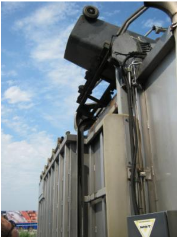
5 juni 2015: Klike's worden geleegd in vrachtwagen Rendac