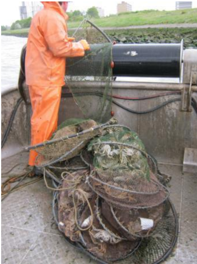
De helft van het treintje schietfuiken - vol met krabben - is binnen