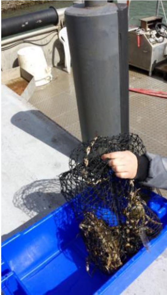
Verzegelde netten worden bij aanlanding geplaatst in bak van transporteur