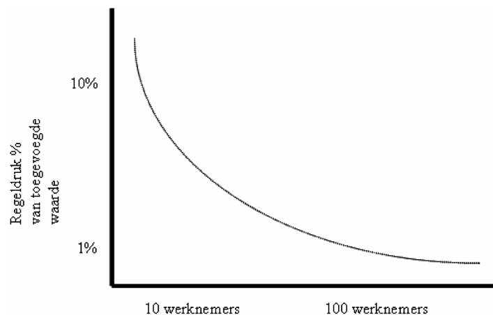
Figuur 1: Kleinbedrijf ondervindt relatief meer hinder van regeldruk (EIM)