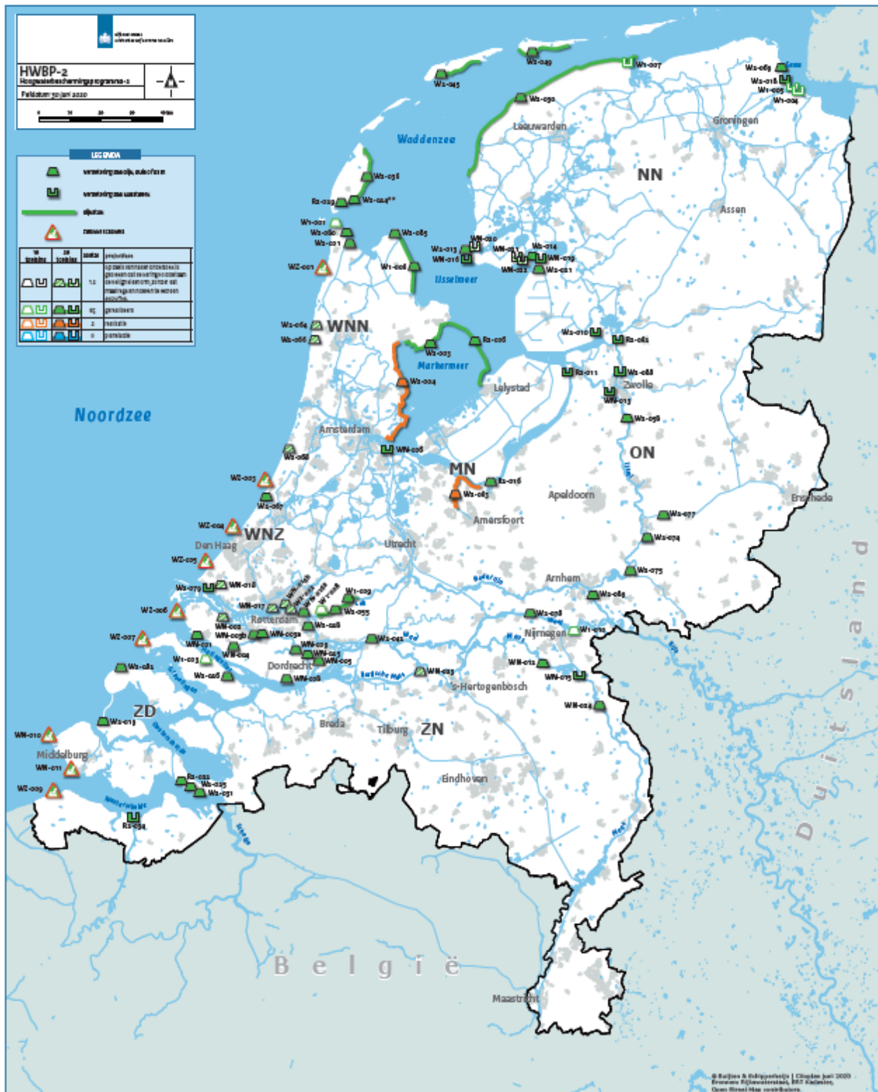
Figuur 2 Actuele scope van het programma, peildatum 30 juni 2020